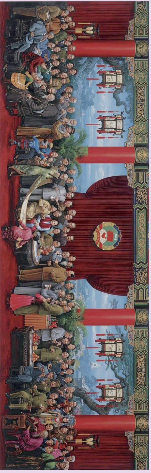
初春（油画，刘宇一绘）

画家以雄浑的笔触、明丽的色彩、丰满的构图，生动地描绘了新中国建立之初，以毛泽东同志为代表的中国共产党人，与各民主党派、无党派民主人士以及各族各界代表人士欢聚一堂，共迎明媚春光、展望美好前程的恢弘场面。图中左二为赵朴初。