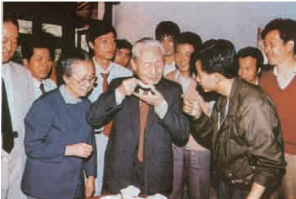
赵朴初与夫人在武夷山品茶。

武夷茶在世界茶叶史上占据十分重要的位置。连日流连于山光水色、历史踪迹中的赵朴初，11月3日又来到武夷山茶科所了解武夷茶的历史和生产情况。这座建在御茶园遗址上的建筑，保留了明代武夷山的风格，室内家具全用杂木、树墩拼制而成，充满山野风味。置身其中，赵朴初观赏了茶师精湛的茶艺，品尝了茶师冲泡的武夷肉桂长寿茶。兴奋之际，他还手蘸茶水，为大家表演了108岁茶寿字的写法。回到下榻的宾馆，他兴趣盎然，铺字蘸墨，一气呵成这首长诗。