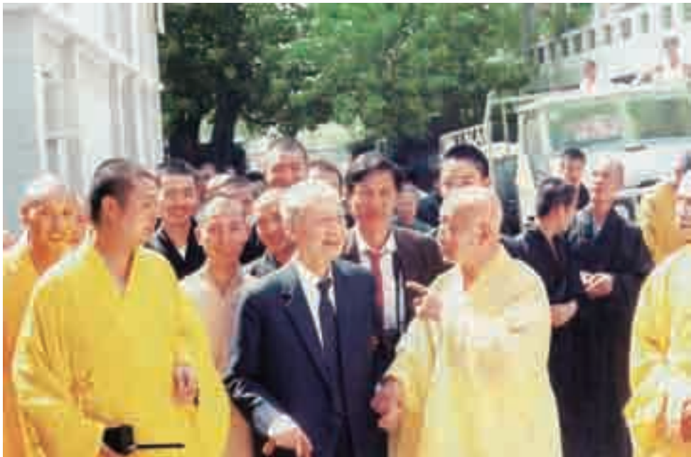
1990年10月，赵朴初在妙湛法师陪同下视察福建闽南佛学院。

（2）西禅寺名列福州五大禅林之一，位于西郊怡山之麓，工业路西边南侧。相传南北朝时炼丹士王霸居此“炼丹成药，点石为丹”。每逢饥岁，便靠卖药卖金换米救济穷苦百姓。后来王霸