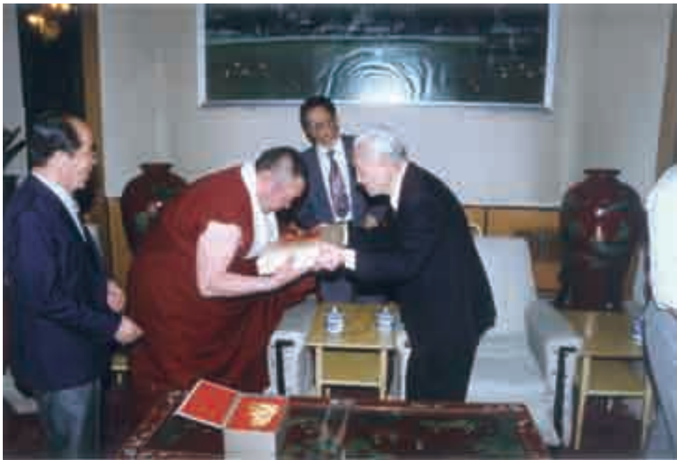
1997年10月，赵朴初会见俄罗斯佛教代表团。

同时，赵朴初指出，“自利的结果 是自害，而利他则能带来自他两利” [5] 268 ，佛教若能以服从服务人民利益为根 本价值诉求，将人民利益作为佛教的根 本利益加以实现，那么佛教利益也就获 得了整体性、长期性的关照与实现。他 认为，“真正的宗教家是应当与人民休 戚相关、血肉相连的”，“以人民利益 为佛教根本利益”的价值逻辑是有教义 根据的：“佛陀说‘一切众生是我父母’， 佛经所载佛陀生平事，几乎全是舍己济 人、救度苦难的故事；佛经上说，一切 众生是树根，诸佛菩萨是花果，以大悲 水利益众生，才能结成佛菩萨的果，没 有众生，就没有任何成就” [5]318 ；“佛 教徒的根本利益就是人民的利益” [5] 115 。