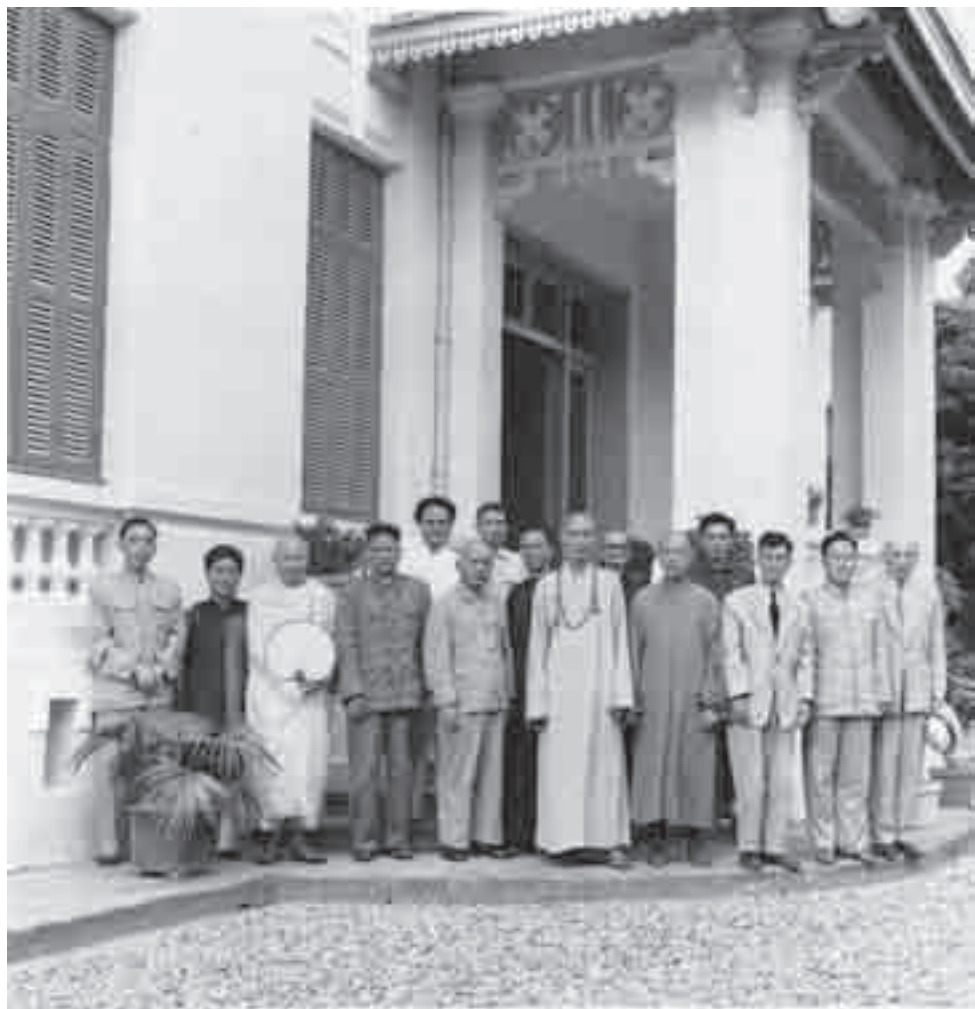
1965年，赵朴初陪同持松法师访问印度尼西亚。

该时期，西方帝国主义势力、国民党反动势力、边疆民族分裂势力等敌对势力均利用中国宗教对新中国实施敌对破坏活动，严重威胁、损害人民政权与人民民主制度的安全、人民群众生命财产安全、我国主权和领土完整，整体性构成了对新中国国家机器的“存在性威胁”，这也使作为被利用工具的中国宗教成为了关涉国家安全利益的重要变量 [1] 。