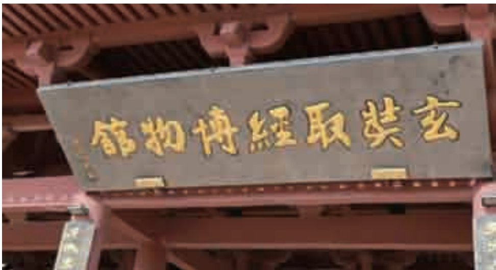
赵朴初题名玄奘取经博物馆