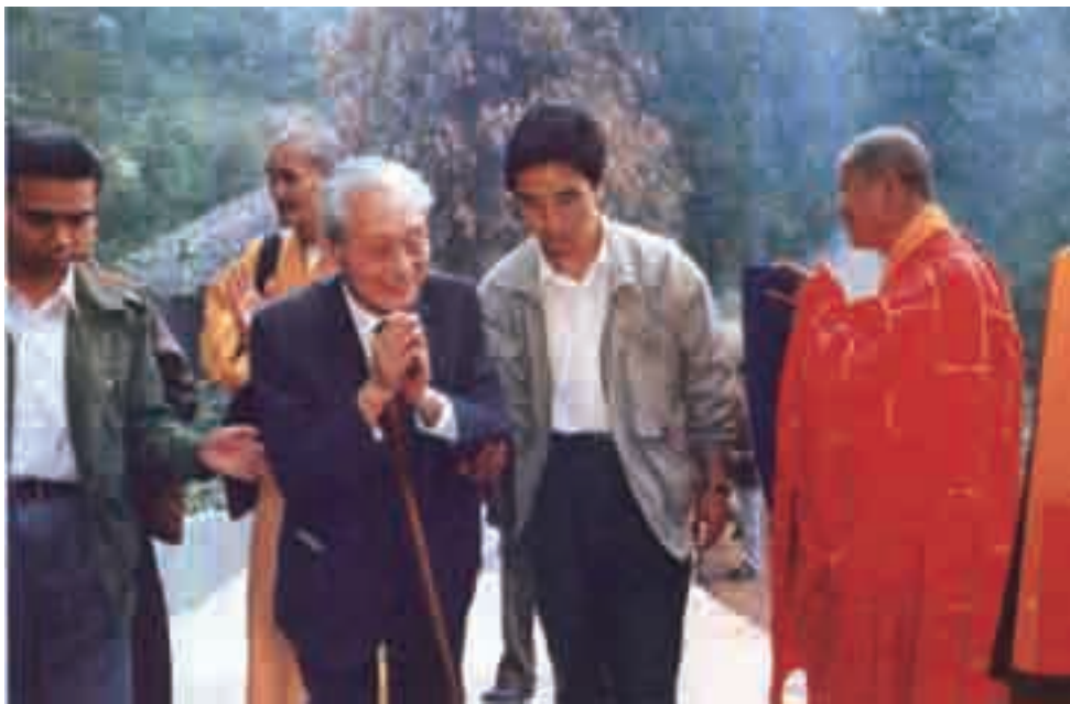
1990年10月2日，赵朴初视察三祖禅寺，受到住持宏行法师（右）的欢迎。

(1)乾元寺：即三祖寺，位于安徽省潜山县天柱山南面景色怡人的凤形山上，为南朝国师宝志禅师开创，梁武帝赐名山谷寺。隋初，禅宗三祖僧璨来此弘法参禅，并传衣钵给四祖道信，于公元606年在此立化，故称三祖寺。后，唐肃宗赐三祖寺名为三祖山谷乾元禅