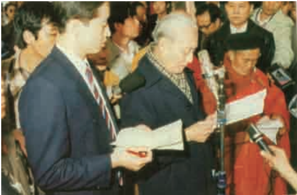
1988年，赵朴初出席佛指舍利宝塔落成庆典。

在赵朴初的安排下，吴立民前后三次到法门寺现场，反复对证中外古籍特别是日本资料，历时一年，终于全面破解、诠释出法门寺地宫原是佛舍利供养唐密曼荼罗，即大唐王朝在法门寺地宫以数千件稀世珍宝组成唐密曼荼罗，安