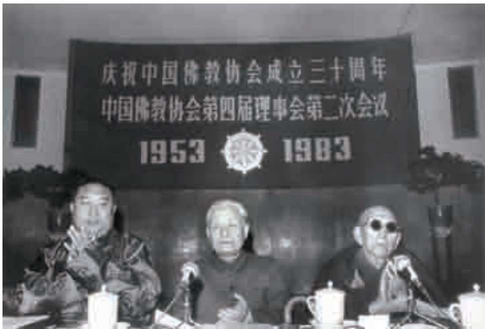
1983年12月5日，赵朴初与十世班禅、老嘉雅活佛在中佛协四届理事会第二次会议开幕式上。

空子的机会”“一般信仰鬼神的人不得视为佛教徒”“佛教宗教活动应以佛教寺院、佛教团体或居士家宅为范围” [5] 71。