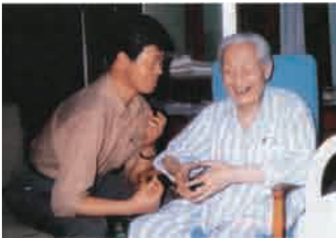
赵朴初听取韩先科关于法门寺地宫唐密曼荼罗文化陈列的汇报。