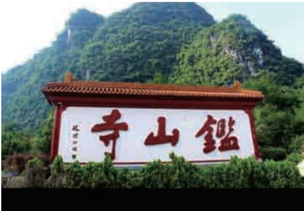
赵朴初题名广西鉴山寺

着解除自身对国家安全利益的威胁，更意味着全面适应新民主主义社会和社会主义社会是中国宗教伴随中国社会形态革命性变革的自我更新。