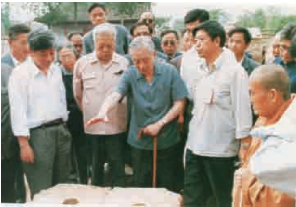
1987年，赵朴初视察法门寺

赵朴初说：这些文物不独等级高、品种多，有的甚至完好如新。这次发现是我国历次唐代文物发掘中最稀有的。它将为我们研究唐代的政治、经济、文