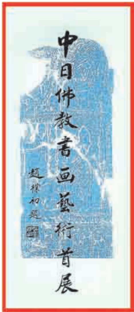
赵朴初题名中日佛教书画艺术展

击一切窜入宗教内的任何阴谋活动，“清除混入教内的少数反动分子，特别是受帝国主义和蒋介石匪帮所指使的间谍特务，以及假托佛教徒企图隐藏的反动会道门分子，与全国人民结成牢固的爱国统一战线” [5]116 。（3）佛教徒“传授‘三皈依’时必须经过一定可靠的介绍手续和审查，而且还要负起经常教育的责任；不盲目发展会友，以免给反动会道门钻